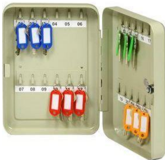
TS 24 B