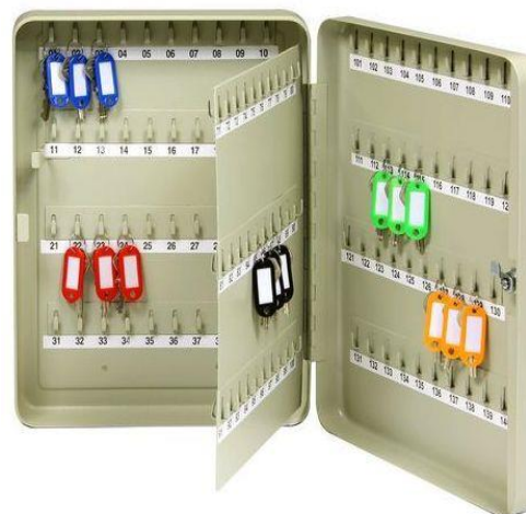
TS 140 B