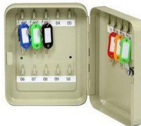
TS 15 B