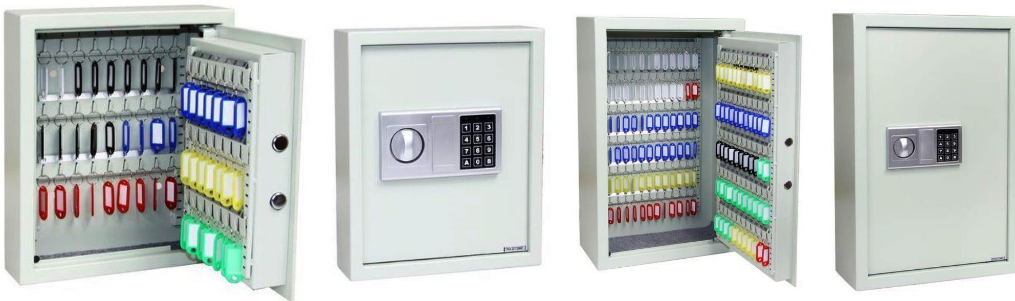
KS 48 – elektronický zámek + 2 x nouzový klíč