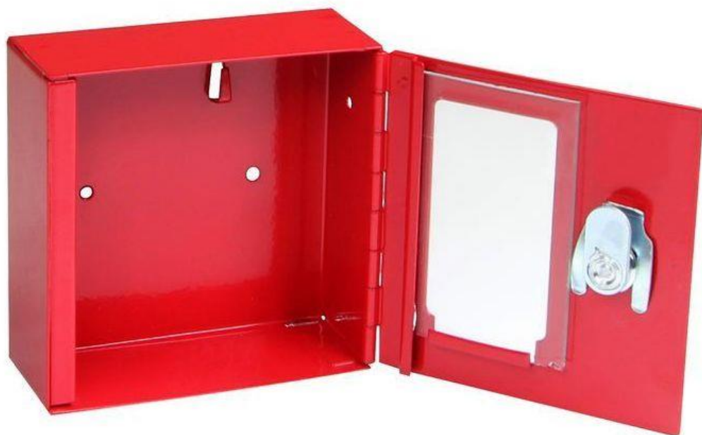
Požární skříňka TS 1010 G /rozbití skla loktem ...