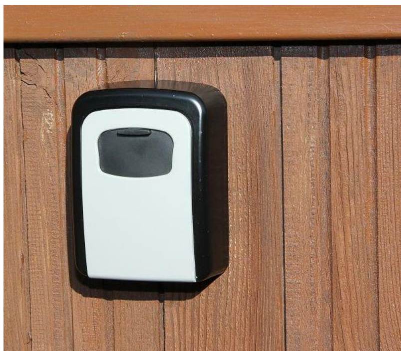
KB G3 - instalace