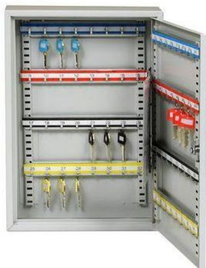
TS 64 D1