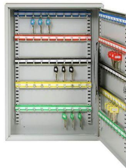
TS 100 D1