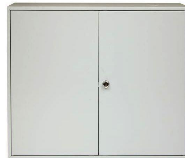
TS 600 D2