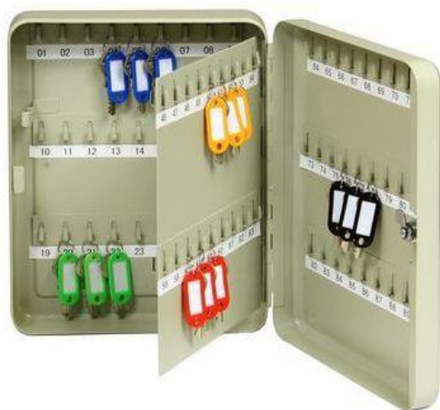
TS 90 B