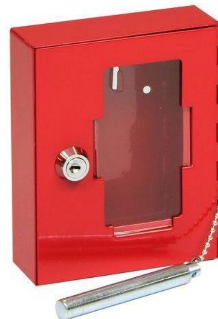
Požární skříňka TS 1021 G /rozbití skla ocelovou tyčinkou