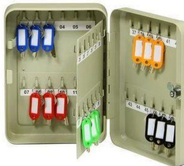
TS 48 B