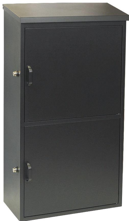
Dvojitý box BK.50-2.CM