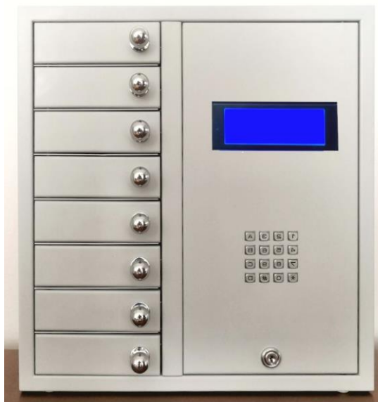
GSM BOX 8 klíčů