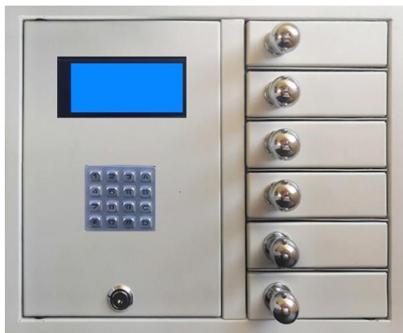
GSM BOX 6 klíčů