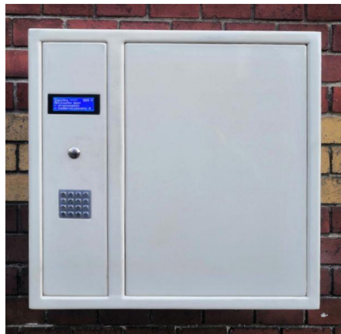
Vnější rozměry v x š x h: 606 x 604 x 500 mm

Box řeší nonstop ukládání balíků. Je ovládaný pomocí mobilního telefonu, který má u sebe každý dopravce.