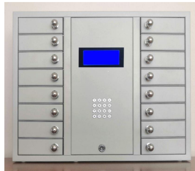
GSM BOX 16 klíčů

Box řeší nonstop ukládání a výdej klíčů. Jsou ovládané pomocí mobilního telefonu, který má dnes u sebe téměř každý člověk.