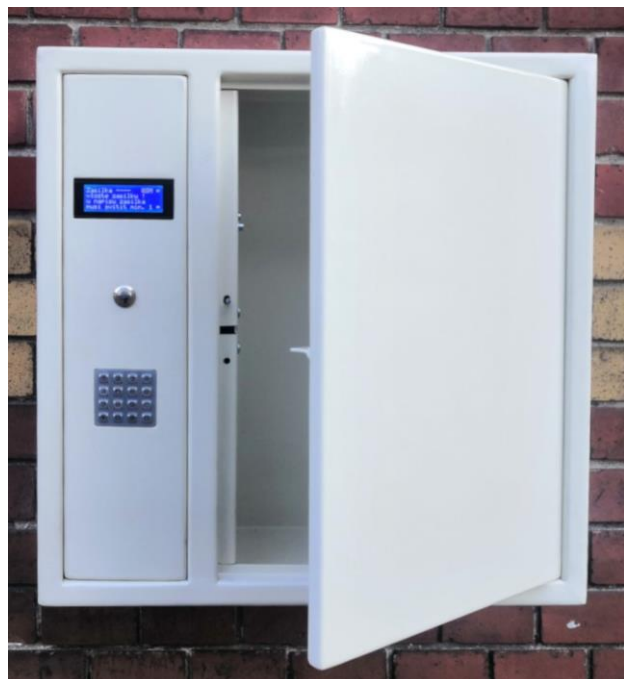
Úložný prostor v x š x h: 600 x 420 x 500 mm