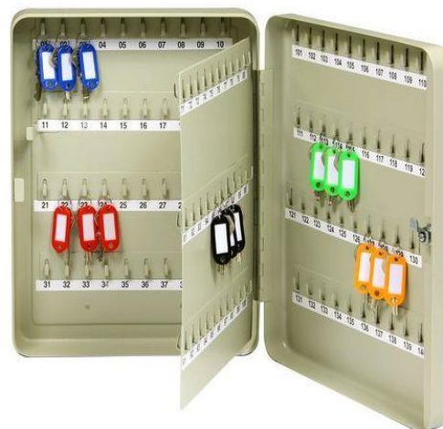
TS 140 B