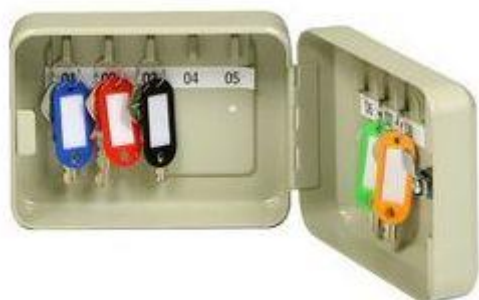
TS 9 B